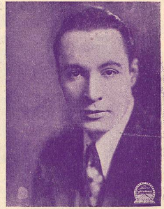
R. LA ROCQUE. une vedette de la Paramount