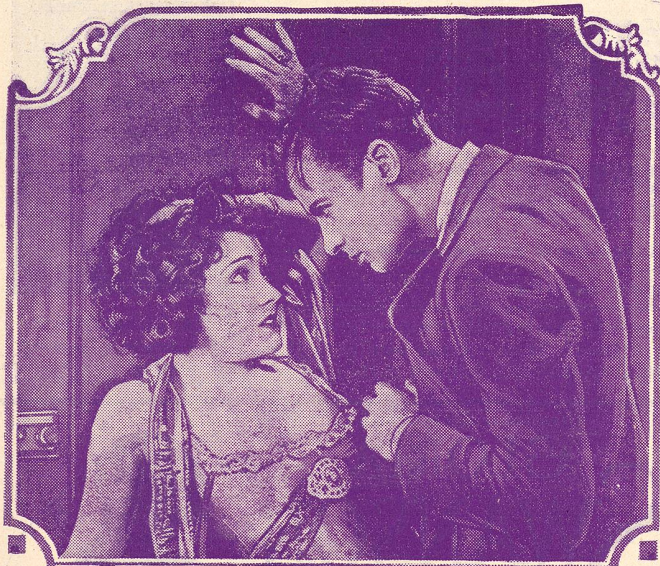
GLORIA SWANSON dans „la Huitième Femme de Barbe-Bleue”