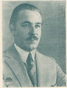
NOAH BEERY une vedette de la Paramount