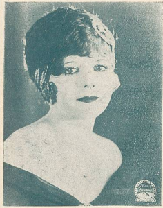
V. REYNOLDS une vedette de la Paramount