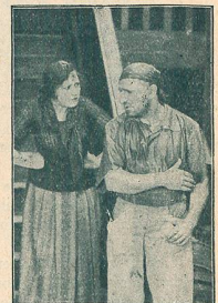
Une scène de La Nuit de la Revanche Vanel, chef des contrebandiers.