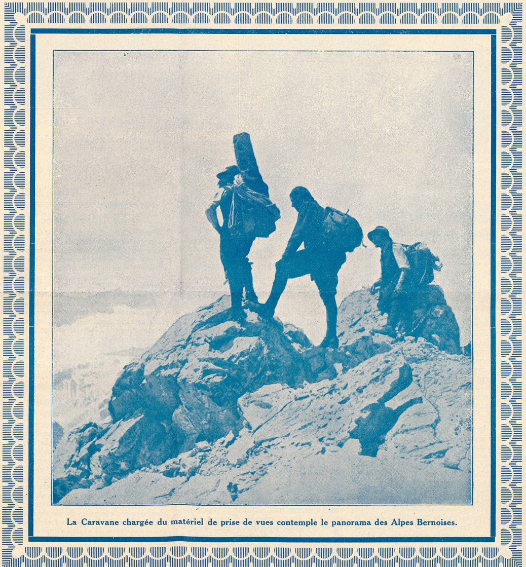
La Caravane chargée du matériel de prise de vues contemple le panorama des Alpes Bernoises.

soixante mètres, c'est alors que je constate avec stupeur que les deux châssis qui me restent n'ont pas de film pour « amorcer » ! Que faire ? Ici point de chambre noire ! Nous ne pouvions pourtant pas interrompre notre travail, perdre une journée pour une bêtise pareille !