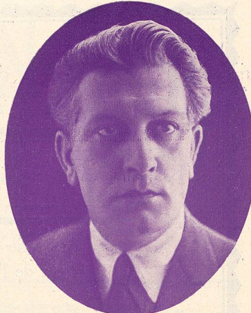
LÉON MATHOT „L'Ami-Fritz“

FILM LA FIÈVRE DE L'OR avec CHARLOT sorti au Strand Théâtre. Succès extraordinaire, immense, battant tous les records New-York, même ceux du Capitole dont le succès plus grand que Stand. Plus de quarante mille personnes en trois jours.