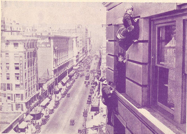
Dorothy Devore dans Hold Your Breath