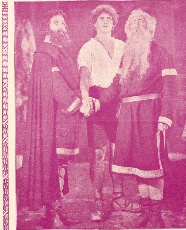
LE SERMENT DES TROIS SUISSES

Dans cette œuvre, qui repose de tant de niaiseries et d'outrances, on voit passer comme les strophes d'un poème pastoral, les scènes classiques des premiers temps de la Confédération : la place d'Altdorf et sa vie rurale, les exactions des baillis, les premiers signes de la révolte populaire, les épisodes de Tell et de Gessler, Stauffacher outragé devant sa maison, Melchthal, fuyant la vengeance des tyrans, Furst dans sa demeure patriarcale, les conciliabules qui précèdent la première alliance, l'expulsion des baillis et enfin, la bataille de Morgarten, qui est la finale de l'œuvre.