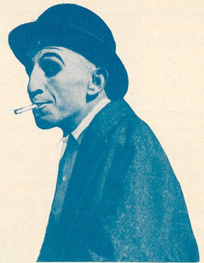
ZIGOTO est au Modern-Cinéma

extraordinaire et unique d'une tempête avec sauvetage de navire comme l'on a jamais vu au cinéma. Les Naufragés de la Vie est à lui seul un spectacle de tout premier ordre qui est à recommander au public. Egalement au programme Pierrot et Pierrette , interprété par René Poyen (ex Bout-de-Zan) et la petite Boublou et Charpentier, est une comédie dramatique et humoristique en 3 parties. A chaque représentation le Ciné-Journal suisse , avec ses actualités mondiales et du pays.