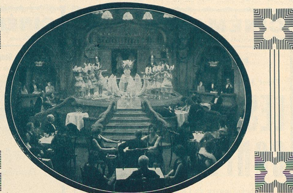
Une autre scène du film UN RÊVE DE BONHEUR.

— Certes ! fit l'homme en riant, autrefois ma mère me peignait ou me coupait les cheveux, j'étais tellement agacé, que je souhaitais ne plus avoir du tout de chevelure et vous voyez que mes désirs ont été exaucés. (Mon Ciné.)