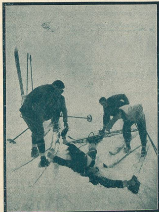
Une scène du film UN RÊVE DE BONHEUR.