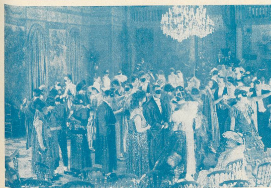
Le Réveil de Maddalone