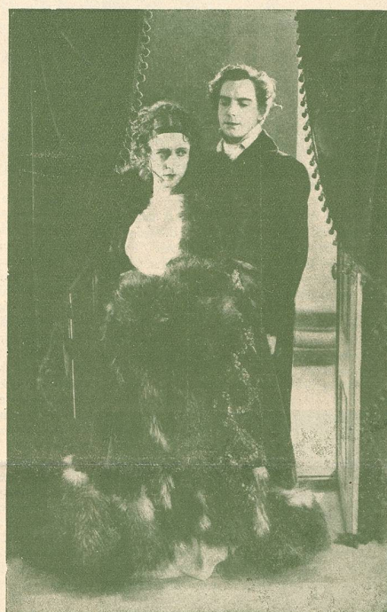
LARS HANSON et JENNY HASSELQVIST dans La Légende de Gösta Berling.