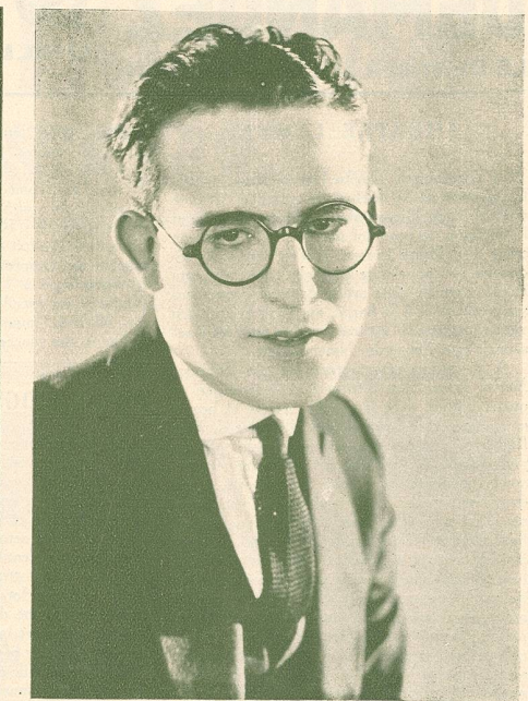
Les Feux follets de l'Abîme.

Harold Lloyd est né à Denver, dans l'Etat de Nebraska, au nord des Etats-Unis, en 1893.