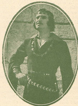
DOUGLAS FAIRBANKS dans ROBIN DES BOIS