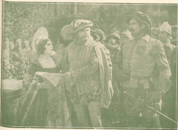
MARY PICKFORD dans DOROTHY VERNON