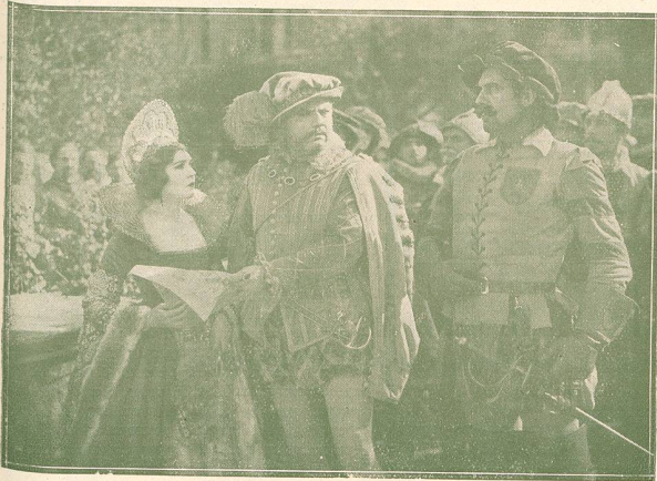
MARY PICKFORD dans DOROTHY VERNON