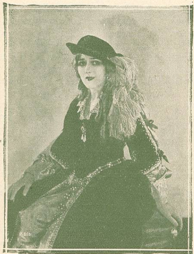
Mary Pickford dans Dorothy Vernon