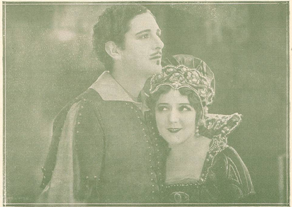
MARY PICKFORD dans DOROTHY VERNON