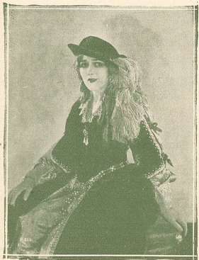
Mary Pickford dans Dorothy Vernon