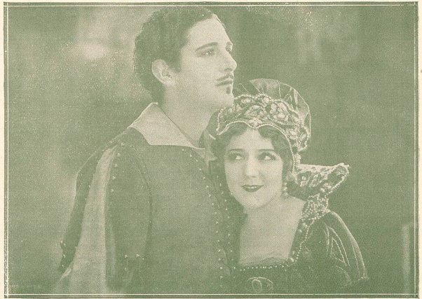
MARY PICKFORD dans DOROTHY VERNON