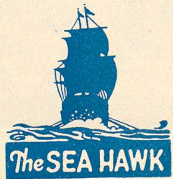
The SEA HAWK

Tous les jours, matinée dès 2 h. 30, soirée à 8 h. 30. Dimanche 12 (Pâques) matinée dès 2 h. 30, soirée à 8 h. 30. Malgré l'importance du programme, prix ordinaire des places.