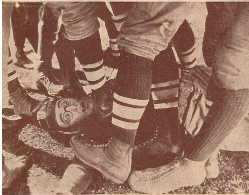
PHOTO - PROGRÈS J. FELDSTEIN Tél. 23.92 28, Petit-Chêne Photo artistique Photo-passeports Travaux d'amateurs