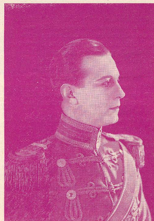
Ch. de Rochefort dans La Princesse aux Clowns

Les enfants de l'Ecole Vinet y ont assisté avec GRAND INTERET ET UN IMMENSE PROFIT, dès le début. Les maîtresses chargées de l'enseignement des leçons comptent sur ces représentations pour illustrer leur enseignement et le compléter.