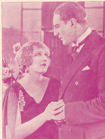
Huguette Duflos et Charles de Rochefort dans La Princesse aux Clowns