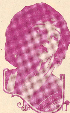
MARGUERITE DE LA MOTTE

Dans Les Dix Commandements , que nous venons de voir, il crée l'imposante figure de Ramsès II.