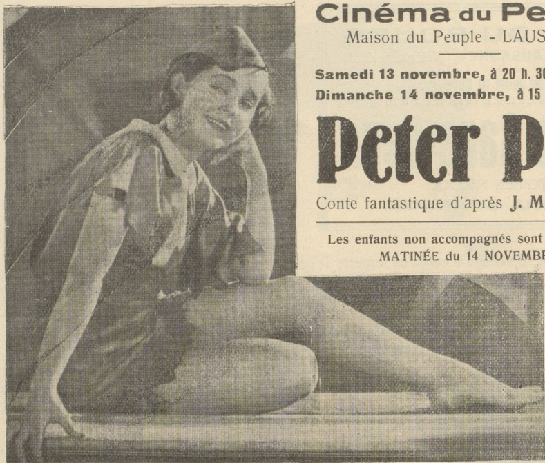
Betty Bronson dans «PETER PAN».