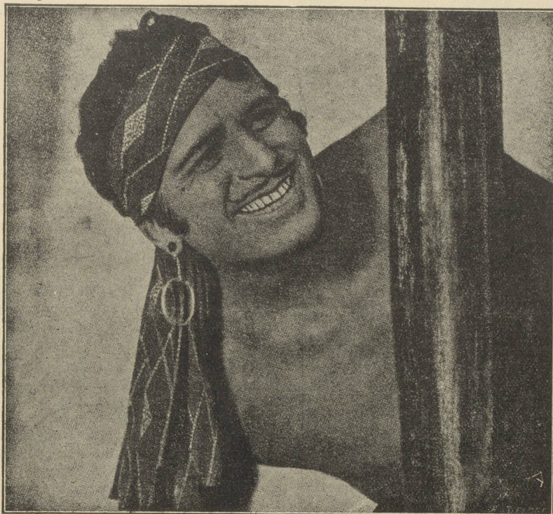
Douglas Fairbanks dans Le Voleur de Bagdad .