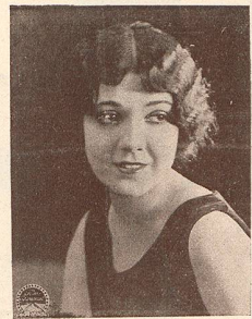
Lila LEE une vedette de la Paramount.