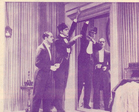
Deux scènes du „FANTOME DE L'OPÉRA“ qui passe au Théâtre Lumen