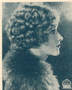
Anna A. NILLSON une vedette de la Paramount.