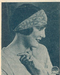
LEATRICE JOY une vedette de la Paramount.