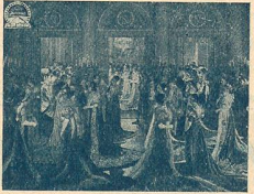
M me Sans-Gêne à Malmaison