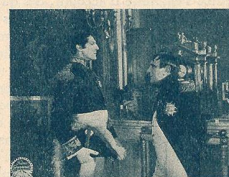
Une entrevue de Napoléon avec le Maréchal Lefebvre