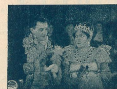
M me Sans-Gêne au Théâtre de la Cour