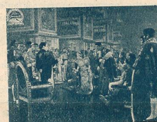
Présentation de M me Sans-Gêne à Napoléon