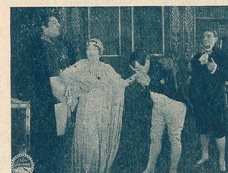
Même scène que N° 2