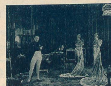
Napoléon et ses sœurs