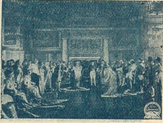
La cour impériale