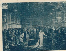
M me Sans-Gêne à la Cour