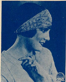
LEATRICE JOY qui joue un double rôle dans

L'autre film : Souvent Femme variée , est interprété par Leatrice Joy qui joue un double rôle. C'est un chassé-croisé matrimonial qui est le type du vaudeville à tiroir, échange de femme entre deux maris complaisants, mœurs américaines, mais histoire amusante. Le public en aura pour son argent, car comme toujours au Cinéma-Palace, les programmes sont incontestablement très bons et très substantiels.