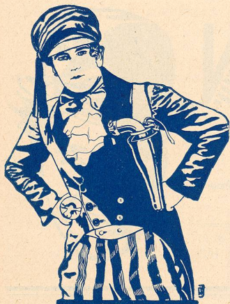
UN NOUVEAU DOUGLAS