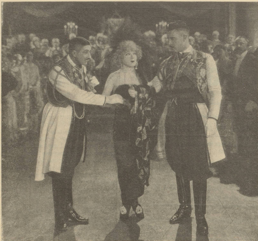
Une scène de « La Veuve Joyeuse » au Théâtre Lumen.