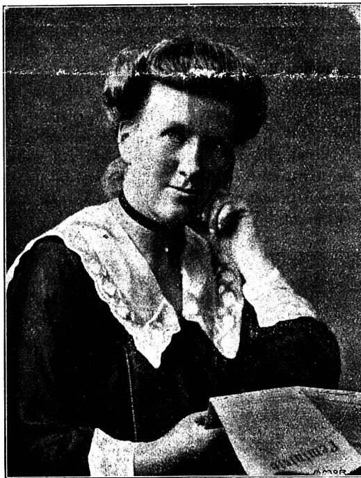
« L'Idée marche... »

Et ce ne sont pas seulement des conversions que le Mouvement a opérées. C'est aussi une éducation des femmes, ainsi que