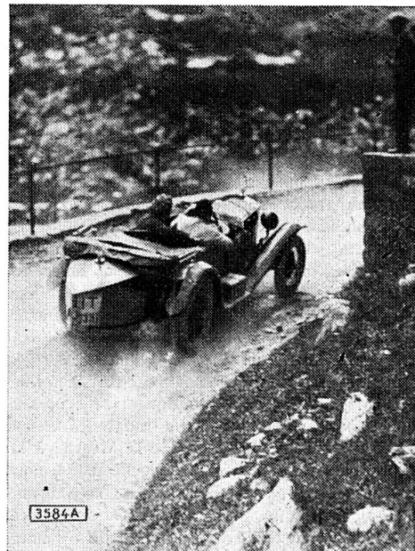
La comtesse Einsidel (Autriche) l'une des gagnantes de la course du Klausen

M me Lüning (Hamburg) pilotant une Fiat au dernier tournant