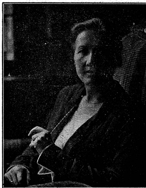
Cliché Mouvement Féministe

la nouvelle Présidente de l'Association suisse pour le Suffrage féminin