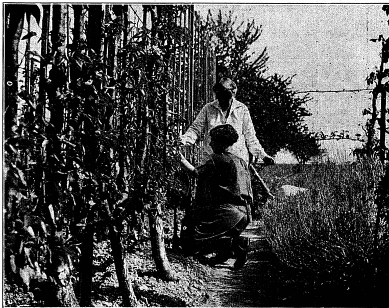
Ecole d'Horticulture de la Corbière (Estavayer) Leçon de taille des arbres fruitiers