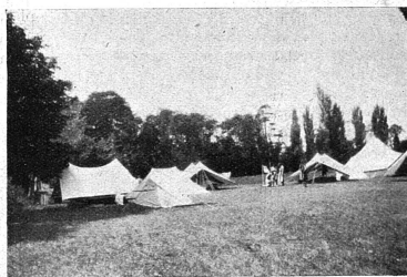
Au camp d'Areuse

Deux cents chefs éclairées suisses se sont réunies en un premier camp international du 21 au 30 juillet à Areuse sur les bords enchantés du lac de Neuchâtel; les tentes au nombre respectable de 77 formaient un véritable village installé dans l'immense clairière de propriétés privées. Rien n'y manquait: les salles de réunion qui servaient aussi de réfectoire en cas de pluie étaient représentées par trois immenses tentes rondes qui fort heureusement n'ont pas été employées souvent, le soleil n'ayant presque cessé d'éclairer le grand mât au haut duquel flottaient le drapeau suisse et le drapeau international des Eclairées: le trèfle or sur fond bleu; la « boutique » où voisinaient les choses les plus imprévues et qui donnait asile au secrétariat du camp; l'infirmerie sous la direction d'une « sourcienne » expérimentée et dont le lit moelleux (j'en ai tâté!) n'a pas été mis à contribution, la santé des campeuses ayant été excellente; les installations sanitaires