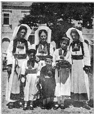
Costumes populaires de Raguse (Dalmatie)

nacrés. D'autres artistes tressent le fil d'argent en bijoux si légers que leur filigrane tremblote au souffle des jeunes femmes. Les fusils et les couteaux des hommes sont aussi richement décorés et le paysan dalmate, farouche et moustachu sous le mouchoir façonné en turban, la courte veste jetée sur l'épaule, le gilet brodé, les boutons et les anneaux de verroterie brillant