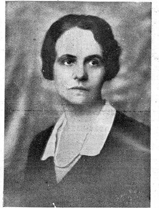
Clitch La Française