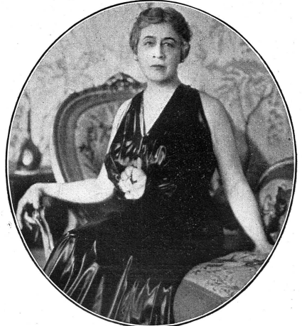
Mrs. Ruth BRYAN OWEN Ambassadeur des Etats-Unis au Danemark

Il y a bientôt vingt ans que le Danemark a reconnu aux femmes l'égalité civique complète avec les hommes. Les femmes possèdent là-bas une représentation importante dans tous les pos-