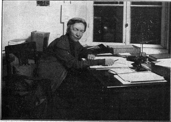
Mlle Kerstin HESSELGREN (Suède)

sénateur, inspectrice du travail, qui préside avec clarté et savoir-faire la V e Commission de l'Assemblée (questions sociales et humanitaires).