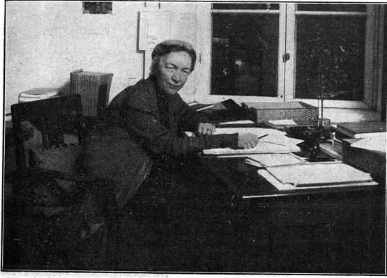
Mlle Kerstin HESSELGREN (Suède)

sénateur, inspectrice du travail, qui préside avec clarté et savoir-faire la V e Commission de l'Assemblée (questions sociales et humanitaires).