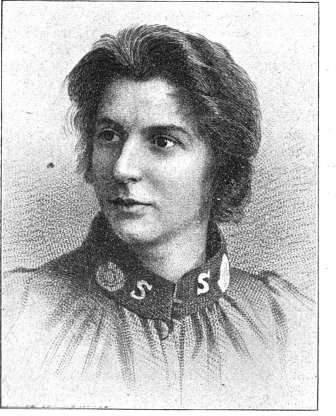
La nouvelle „Générale“ Evangeline BOOTH dans sa jeunesse.

Auteur de plusieurs livres, musicienne, compositeur, orateur, la générale est docteur ès lettres. A l'occasion des services qu'elle a rendus pendant la guerre, elle a été décorée par le Président des Etats-Unis. Elle est très populaire en Amérique.