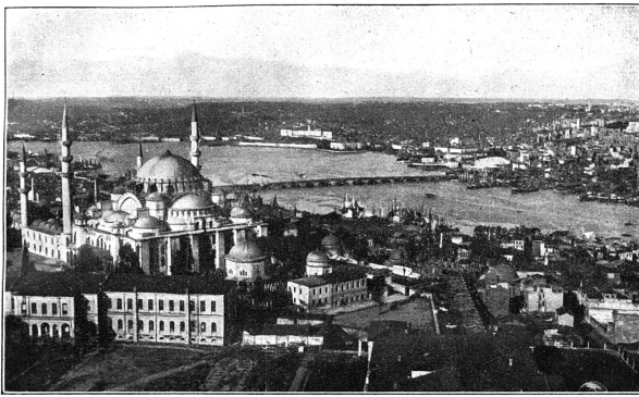
Istanbul, Mosquée de Suleyman et la Corne d'Or

ABONNEMENTS SUISSE . . . . . Fr. 5.— ÉTRANGER . . . . . 8.— Le numéro . . . . . 0.25 Les abonnements partent du 1 er janvier. À partir de juillet, il est différé des abonnements de 6 mois (3 fr.) établis pour la somme de l'année en cours. ANNONCES La ligne ou son espace : 40 centimes Réductions p. annonces répétées