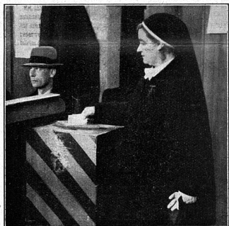
Le geste qu'aucune femme ne saurait accomplir sans perdre immédiatement toutes ses qualités...

Du point de vue féministe encore, qui nous intéresse surtout ici, il est intéressant de relever que, comme nous avions déjà eu l'occasion de le constater, il y a quatre ans, lorsque les