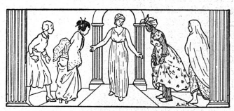
Les Femmes et la Société des Nations

donc de ce système qu'usèrent les principales Associations féminines, étendant leur action non seulement sur l'agglomération parisienne, mais encore dans leurs sections départementales.