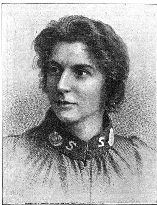
La « générale » Evangéline Booth dans sa jeunesse.

Rien ne pourrait dépeindre l'enthousiasme dont fut l'objet cette femme de soixante-dix ans, droite comme un I, qui a derrière elle un tel passé de travail, dont les traits sont empreints à la fois de bonté et d'une indomptable énergie, et qui dirige une des plus vastes organisations religieuses et philanthropiques du monde entier. A son contact, il semble que l'on soit touché par une parcelle de radium.