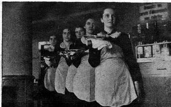
Service aimable, malgré la suppression des pourboires