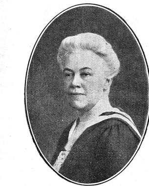
Cliché Jus Suffragii