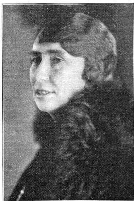
Ch. M. Mouvement Féministe