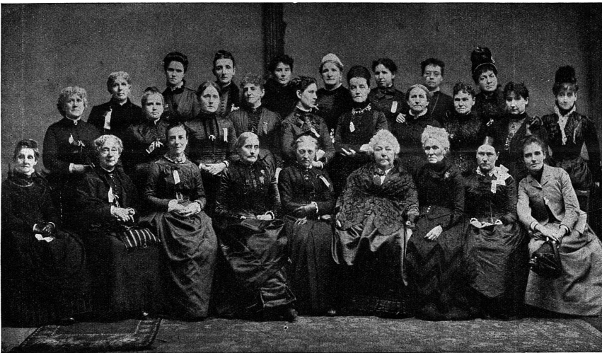
La fondation du Conseil International des Femmes en 1888