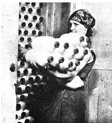
La porteuse de bobines