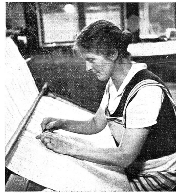
La contrôlease du tissu

(Travail de force musculaire, le poids d'un de ces ballots étant d'environ de 20 kg.)