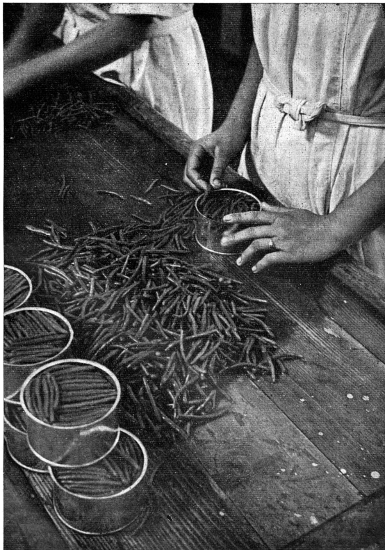
Une industrie de l'alimentation

La collaboration féminine au travail national