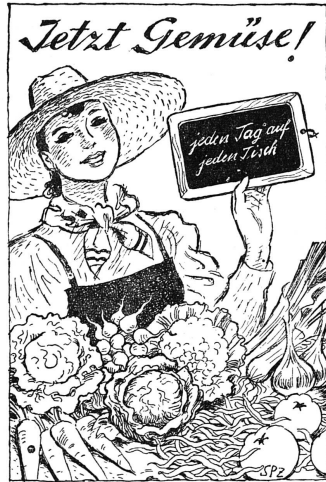
Reproduction de la jolie affiche de l'Office de propagande pour les produits de l'agriculture suisse, qui mène en ce moment une campagne en faveur des légumes du pays « tous les jours sur toutes les tables ».

les démocraties anglo-saxonnes — la preuve en a été donnée par la récente déclaration Roosevelt-Churchill — d'étudier les moyens d'éviter ce plan d'un manifeste appelé avec trop de raison les «massacres» à répétition et l'autodestruction systématique de notre humanité». « Personne ne peut prévoir l'avenir » ajoute avec raison ce manifeste, mais « chaque homme et chaque femme conscients de leurs devoirs doivent répandre dès maintenant autour d'eux la bonne semence de la fraternité et de la solidarité ». Nos amies d'Angleterre, notamment, et les féministes étrangères réfugiées à Londres ont déjà mis ensemble sur pied un plan d'études que nous espérons pouvoir publier dans un prochain numéro : aujourd'hui nous estimons nécessaire de mettre sous les yeux de nos lectrices quelques fragments d'un manifeste lancé chez nous par le « Mouvement populaire suisse en faveur d'une fédération des peuples », mouvement dans le Comité duquel siègent des hommes dont le nom déjà nous donne confiance, tels que Pierre Bovet, Th. de Félicie, Paul Meyhoffer, Marcel Raymond, Dr. Henri Revilliod, etc. Et en cette année, où plus que jamais, l'on a célébré et magnifié l'idée confédérale, cette notion de Fédération des peuples ne peut qu'attirer immédiatement notre sympathie. Enfin il est important de signaler dans ce journal le ton nettement féministe de ces déclarations !