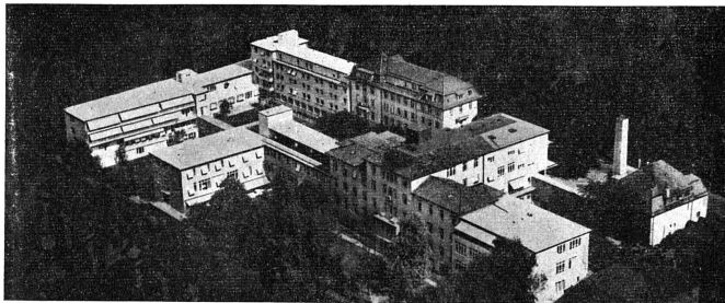
L'Ecole d'infirmières de Zurich, la première du genre en Europe, et qui, dirigée et administrée uniquement par des femmes, a derrière elle 40 ans d'une admirable activité.